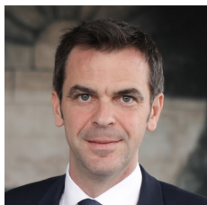
Olivier Véran, ministre des Solidarités et de la Santé

Nous l'avions promis, nous l'avons fait, ensemble. Sept mois après l'annonce du plan de relance des investissements Ségur avec une déconcentration déterminée, l'ARS Auvergne-Rhône-Alpes a élaboré sa stratégie régionale des investissements en santé pour la période 2021-2030.